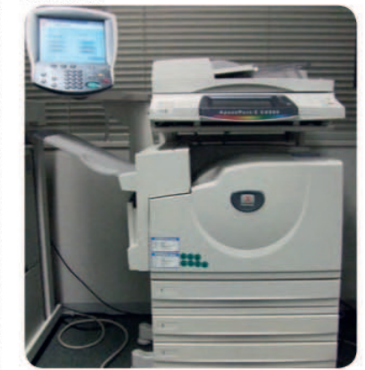
OVERSETTER: Har du et japansk dokument du vil forstå? Fuji Xerox er i ferd med å utvikle en kopimaskin som kan oversette.

IT: En kopimaskin som oversetter teksten? Det er Fuji Xerox sitt svar på en globaliserende verden, og nylig viste de frem en prototype på sin nye vidundermaskin i Tokyo. Legg en side med japansk, koreansk eller kinesisk tekst i dokumentmateren, velg utgående språk, og vips kommer en fiks ferdig side ut. Maskinen tar til og med å ta vare på layouten og eventuelle bilder. Lanseringsdato er ikke bestemt.