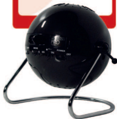
NY «DISKOKULE»: Denne gir et bokstavelig talt et himmelsk lys i stua di.