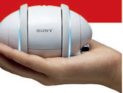
VOKSENT LEKETØY: Sony Rollo kan streamme musikk fra datamaskinen via Bluetooth mens den danser sammen med deg.